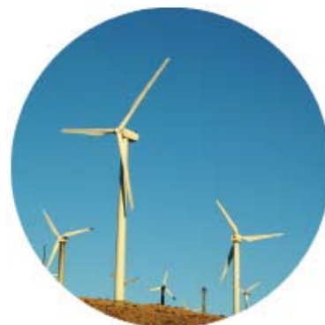
CCS utilisé dans des aérogénérateurs