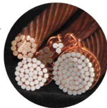
CCS utilisé pour localiser des câbles d'alimentation