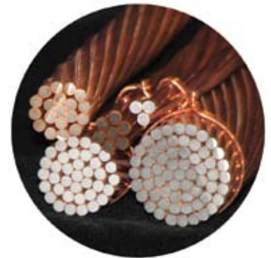
CCS-Verwendung für Stromkabel