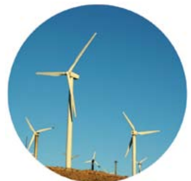
CCS-Verwendung in Windturbinen