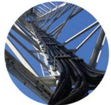
CCS utilizado en telecomunicaciones inalámbricas