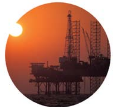
CCS utilizado en aplicaciones geofísicas