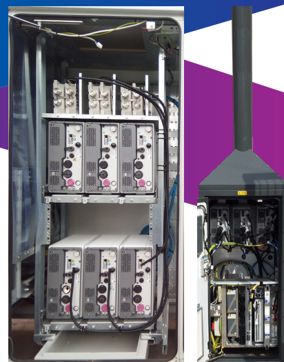
Gabinete de celdas macro

MIMO de alto orden desbloquea una enorme capacidad, pero viene con una gran cantidad de infraestructura. Las soluciones de combinadores ultra compactos multibanda de CommScope pueden simplificar el camino de RF y reducir en gran medida el tiempo de instalación.